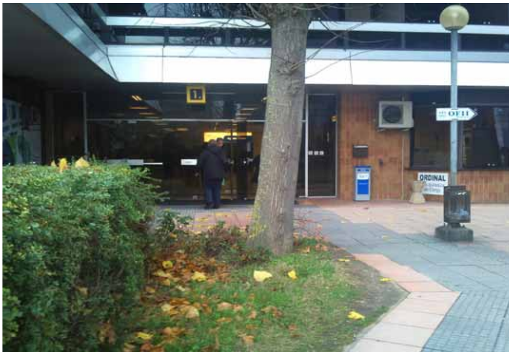
Entrée 1 de l'immeuble ORDINAL