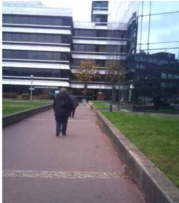
Vue de l'immeuble ORDINAL